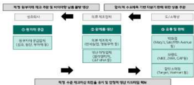
의류 ‘ 주문-생산-판매 ’ 선순환 구조도

최근 온라인 유통채널의 급성장으로 인해 바이어의 단납기 오더가 증가하며 리드타임 단축의 중요성이 제고되고 있으며, 패션트렌드 교체주기가 짧아져 재고관리의 중요성이 확대되며 다품종소량생산과 소품종대량생산의 필요성이 동시에 증가하고 있습니다. 소량의 제품을 더 자주, 더 빠른 속도로 생산해야 하므로 OEM업체들의 원가 부담은 커지고 판매 단가는 낮아지고 있는 추세입니다. 따라서, OEM업체들은 생산 기술 차별화로 인한 경쟁우위와 수직계열화를 통한 절대적인 원가를 절감하여 마진율을 개선시키는 것이 가장 큰 성장요인으로 작용하고 있습니다.